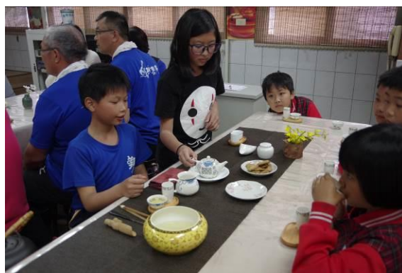
圖六：與隙頂國小茶香文化交流