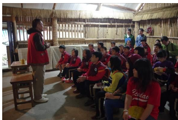
圖二：鄒族文化學習