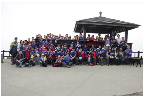
圖五：全校學生登山健行