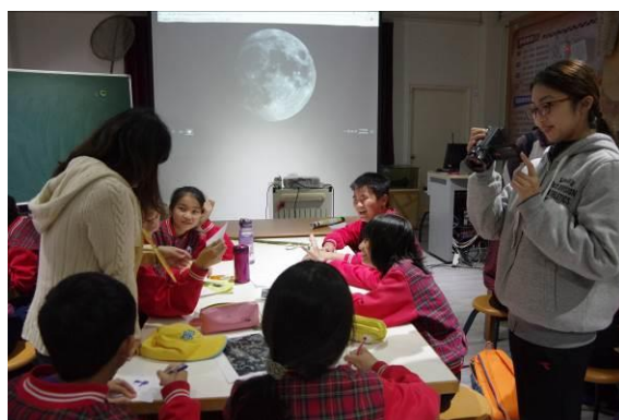
圖四：夜間星空課程