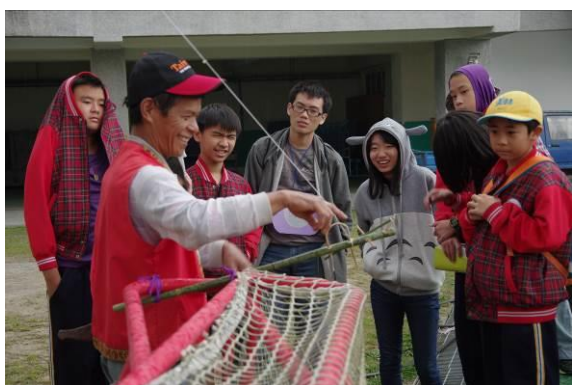
圖三：學習當一個小獵人