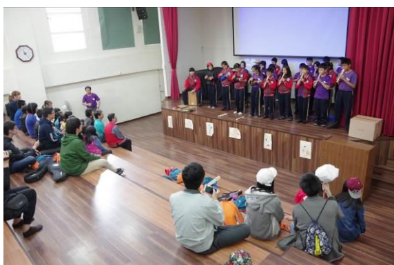
圖一：與達邦國小一同進行交流表演